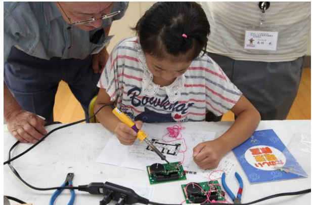
先生たちの手取り足取りの指導で、初めての半田付けもなんのその