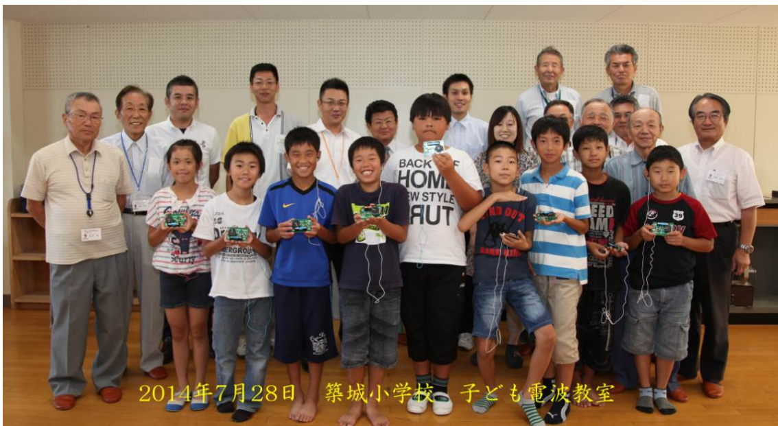
きあがったラジオを持って はいポーズ